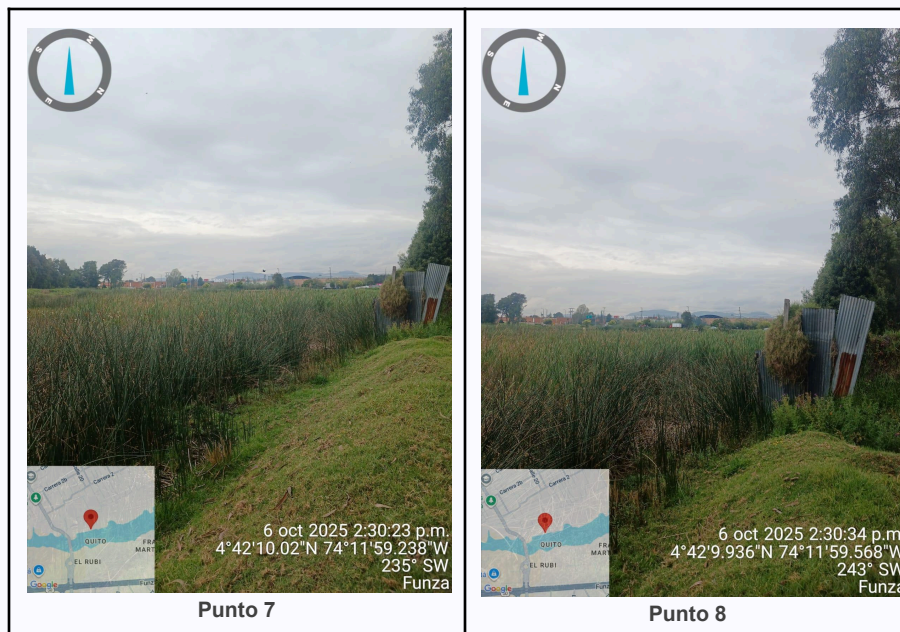
Ilustración 2. Fotos de los puntos del Recorrido de Control Y Vigilancia Ronda Del Humedal Gualí.